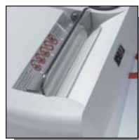
Volet de sécurité électronique