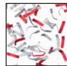
Super micro coupe 0,8 x 5 mm "Niveau 6" Documents classés secret-défense.