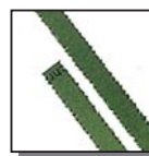
Coupe fibres 4 mm Niveau de sécurité DIN 2 Documents internes.