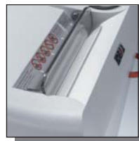
Volet de sécurité électronique