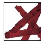
Coupe croisée 4 x 40 mm Niveau de sécurité DIN 3 Documents confidentiels.