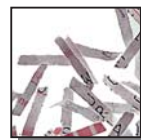
Coupe croisée 2 x 15 mm Niveau de sécurité DIN 4 Documents confidentiels ou secrets.