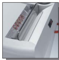
Volet de sécurité électronique